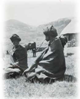
Femmes Bathéphu fumant la pipe